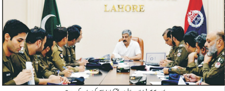
لاہور میں پی او ایل اور جوائنٹ سروس کمانڈر جنرل کی صدارت میں میٹنگ

خراب مالی معاملات، وفاقی اردو یونیورسٹی کا جلسہ تقسیم اساتذہ منسوخ کیا گیا۔