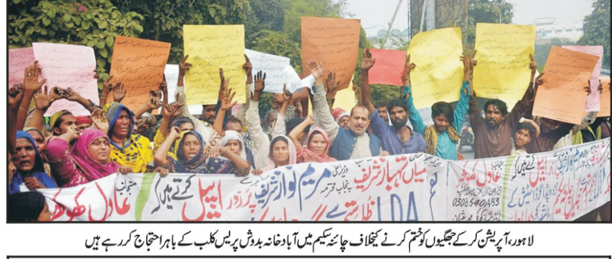
لاہور میں ایک احتجاجی مظاہرہ کے دوران مظاہرین کی طرف سے پوسٹرز اور پوسٹرز کی پھیلنے کی تصویر

پنجاب نوڈ اتھارٹی کا اسٹریٹ ناؤن میں کچھ پونٹ پر چھاپہ مارا گیا۔