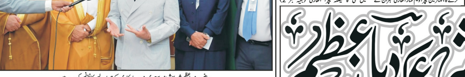
ریاض، وزیر اعظم شہباز شریف سعودی وزیر سیرامیکس کی سربراہی میں وفد کے ساتھ میٹنگ کر رہے ہیں

بجلی کی قیمتوں میں 70 پیسے فی یونٹ کمی کا امکان بجلی کی قیمتوں میں 70 پیسے فی یونٹ کمی کا امکان ہے۔ بجلی کی قیمتوں میں 70 پیسے فی یونٹ کمی کا امکان ہے۔ بجلی کی قیمتوں میں 70 پیسے فی یونٹ کمی کا امکان ہے۔