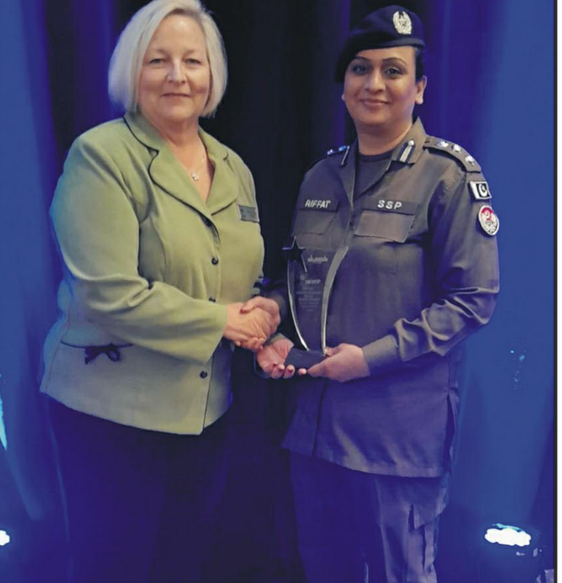
ایڈیشنل ایچ ڈی جنرل آف دین پولیس کی جانب سے پنجاب پولیس کی خاتون افسران ایس بی کے ساتھ ملاقات

ایڈیشنل ایچ ڈی جنرل کی عدالت سے 55 دنوں کی مہلت دینے کی استدعا مسترد